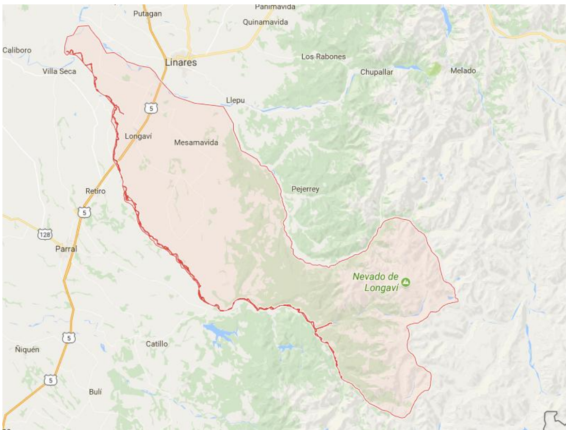
Figura 1: Ubicación comuna de Longaví

La comuna de Longaví se compone por 2 zonas urbanas (Longaví y Los Cristales) y 50 sectores rurales, convirtiéndola en la comuna con mayor población rural en Chile. En la figura n° 2 se puede observar las distintas localidades de la comuna.