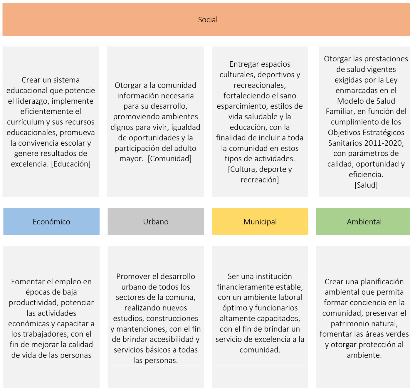
Figura 3: Cuadro resume de los objetivos estratégicos

Para lograr la visión municipal, se propuso los siguientes objetivos estratégicos por área de desarrollo (ver figura 15), obtenidos mediante el diagnóstico estratégico expuesto en las páginas anteriores.