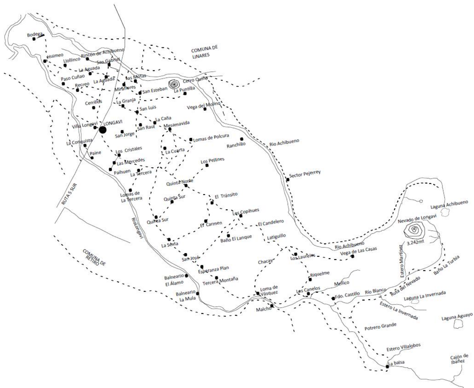
Figura 2: Localidades de comuna de Longaví