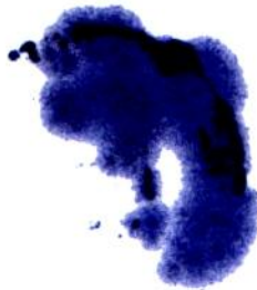
CRISTIÁN MENCHACA PINOCHET ALCALDE I. MUNICIPALIDAD DE LONGAVÍ