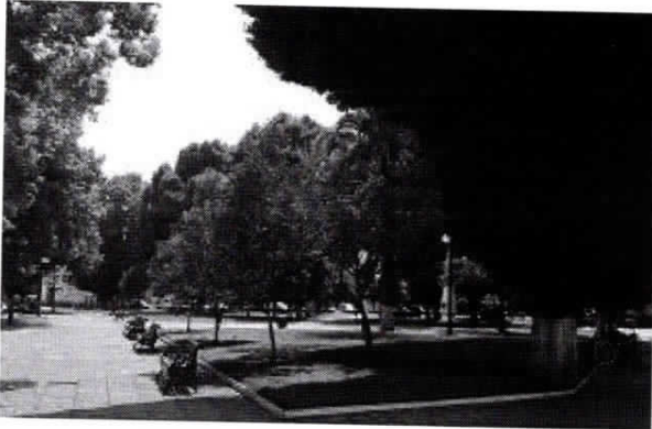
Figura N° 1 Plaza de Longaví