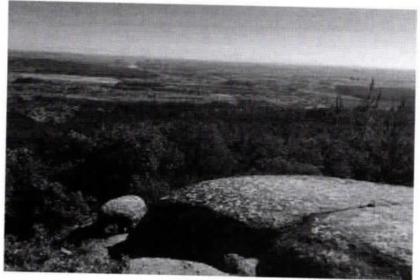
N° 2 Piedra del Batro.

La Comuna se presenta como parte de un sistema intercomunal de servicios y centralidades para las actividades agrícolas de la provincia. A escala local, la comuna está constituida por una red de poblados dedicados preferentemente a la actividad agrofrutícola, que tiene un rol tanto de subsistencia como de abastecimiento a circuitos económicos mayores que la han ido posesionando dentro de una transformación a mercados más intensivos.